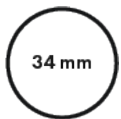
Diametro tubo principale 34mm