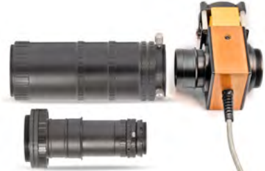
M68 Tele-Kompodium mit TZ-System und geheiztem Solar Spectrum H-alpha Filter