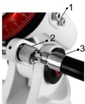
Figura 2 1 Tornillos de fijación, 2 Tuerca de unión, 3 Eje flexible