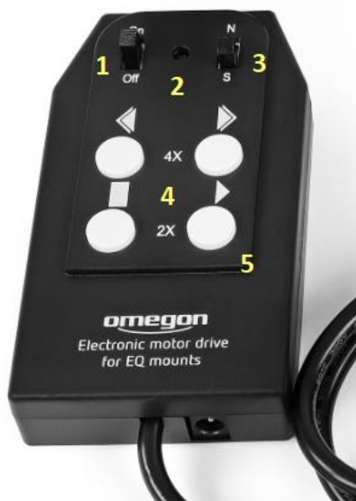
Figura 4 1 On/Off, 2 LED rojo, 3 Norte/Sur, 4 Teclado para velocidades de motor, 5 Conexión para compartimento de pilas

Tenga en cuenta que en el hemisferio norte, el conmutador N/S (3) debe estar ajustado a N de norte. En el hemisferio sur, estará ajustado a S.