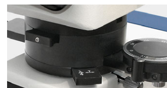
Lentille de Bertrand, λ lame, analyseur pivotable à 360° (amovible)