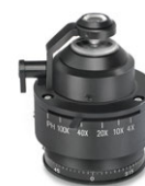
« Swing-Out » Condenseur